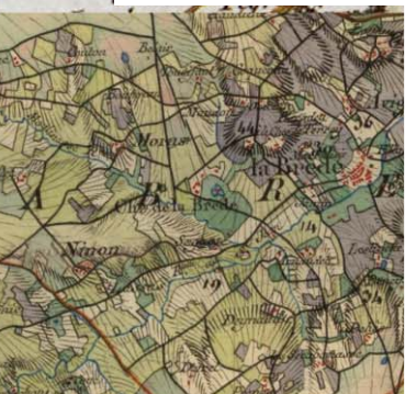
Carte d'état-major, 1820