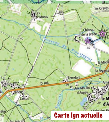
Carte Ign actuelle