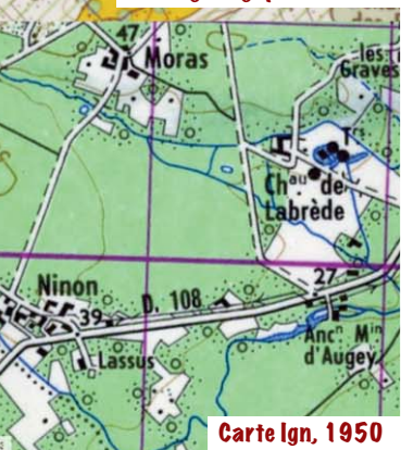
Carte Ign, 1950