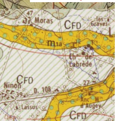
Carte géologique actuelle