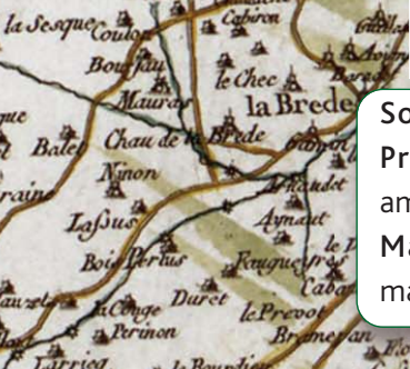
Cassini, vers 1750